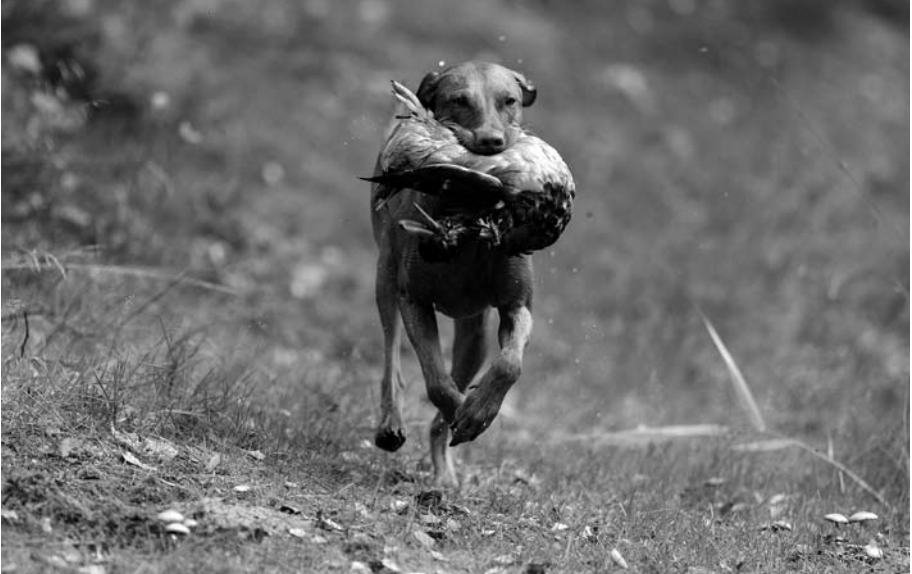
Chin vom Aurumer Berg, 07-UK-3647, Führerin Elke Schneider (Kassel)

Bilder sind entstanden zur Vorbereitung auf die VGP für die Chin vom Aurumer Berg.