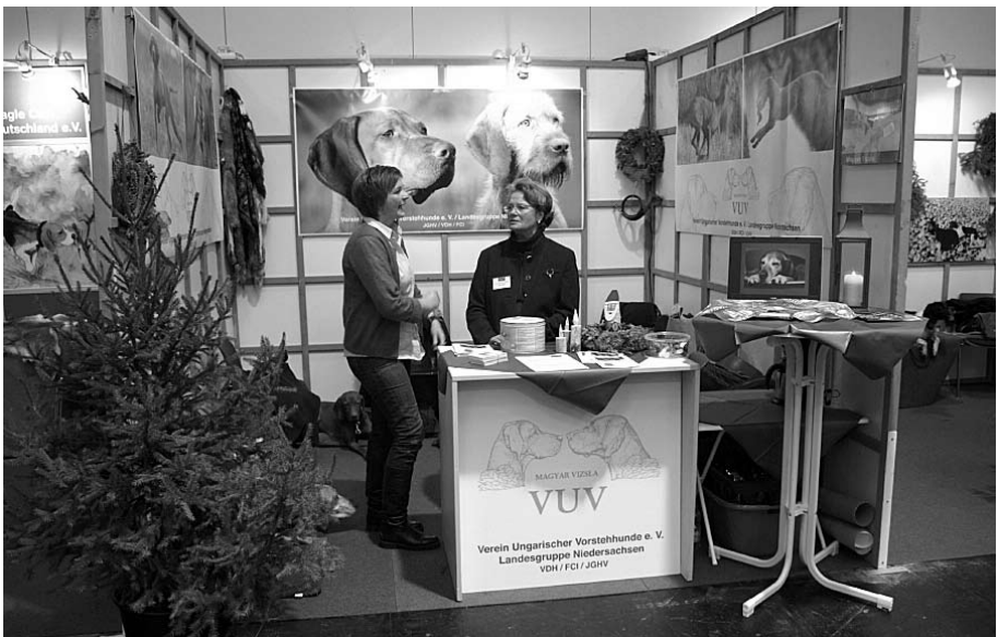
„Freundlich, kompetent, offen“

„Pferd & Jagd“ hat in einer Jahresberichterstattung immer einen festen Platz. Die Messe Anfang Dezember in Hannover ist Anziehungspunkt für eine große Country Fan-Gemeinde. Es ist ganz offensichtlich „auch wer in der Stadt wohnt, darf das Land leben.... Das Lifestyle-Publikum überflutet die Szenerie, der Hund ist treuer Begleiter und Statussymbol“, so stand es in der Presse. Das ist die Realität!