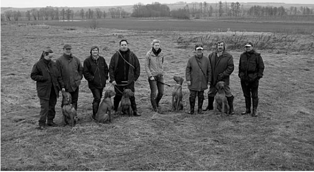
Die Teilnehmer des Erstlingsführerseminar